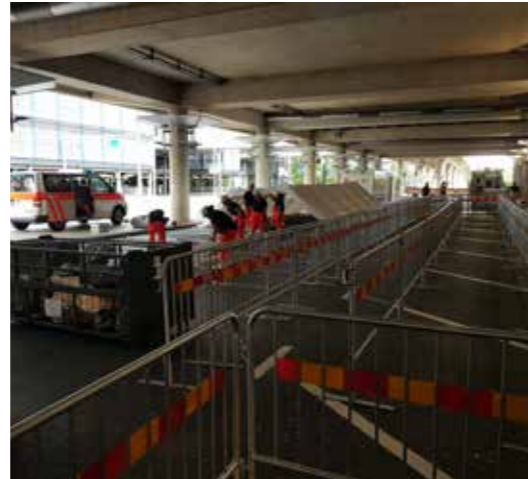
Eine Hand wäscht die andere – Die Flughafenfeuerwehr unterstützt die Johanniter tatkräftig beim Aufbau des Corona-Testzentrums.

Die Corona-Pandemie hat alle vor neue Herausforderungen gestellt, für die es kein „Handbuch“ gibt. Am Hannover Airport wurde unter Leitung des Gesundheitsamtes der Region Hannover und in enger Zusammenarbeit mit der Johanniter-Unfall-Hilfe ein Corona-Testcenter eingerichtet. Neben dem Terminalmanagement waren alle technischen Gewerke des HAJ und die Flughafenfeuerwehr eingebunden, um in der Ankunftsebene des Terminal C in kürzester Zeit ein einsatzbereites Testcenter mit kompletter Infrastruktur einzurichten. Hier haben alle Bereiche erneut ihre Flexibilität und Leistungsfähigkeit unter Beweis gestellt.