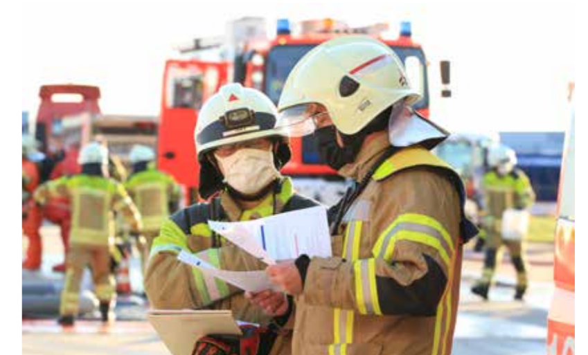
Gemeinsam stark – Die Abstimmung zwischen Stadtfeuerwehr Langenhagen und Flughafenfeuerwehr ist unabdingbar.