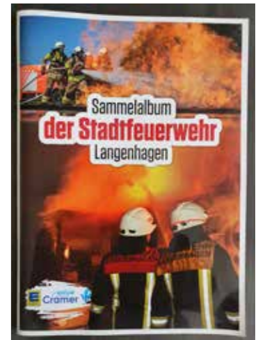
Sammelspaß für Groß und Klein

Zur Stadtfeuerwehr Langenhagen gehört auch die Flughafenfeuerwehr als hauptberufliche Werkfeuerwehr im Stadtgebiet. Somit wurde auch der Airport zur Teilnahme angefragt. Ein schönes Signal im Sinne der hervorragenden Zusammenarbeit zwischen den Freiwilligen Feuerwehren und der Flughafenfeuerwehr und selbstverständlich waren wir mit Gruppenbildern unserer Kollegen und Fahrzeugbildern dabei. Ein tolles Erinnerungsstück für die Zukunft!