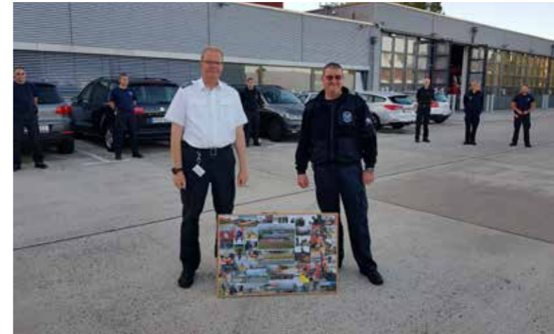
Die Mannschaft sagt Tschüss!