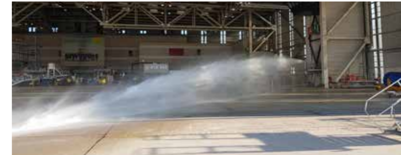
Löschmonitore im Flugzeughangar der TUfly

Zur Warnung von Personen im Gefahrenfall