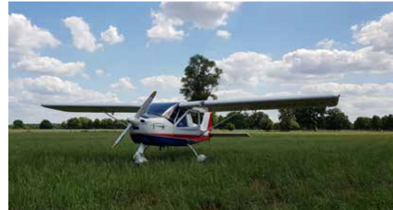
Immer zur Stelle – Die Flughafenfeuerwehr hilft auch den Kleinsten.

Gute Nerven und fliegerisches Geschick hat der Pilot eines Ultraleichtflugzeuges bewiesen. Angekündigt als „Full Emergency“ wegen Motorproblemen wurde die Flughafenfeuerwehr alarmiert und stand bereit. Der Pilot schaffte die verbleibende Distanz bis zum Hannover Airport aber nicht mehr und musste auf einer Wiese notlanden. Da zum Piloten keine Verbindung mehr hergestellt werden konnte, wurde unter anderem der Polizeihubschrauber zur Ortung der Maschine alarmiert und die Einsatzkräfte konnten zur Einsatzstelle gelotst werden. Sowohl die Maschine, als auch die Insassen haben die Notlandung unversehrt überstanden.