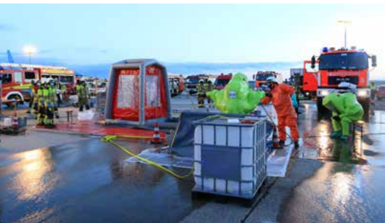
Auf alles vorbereitet – Die Dusche immer dabei.

rio, was nach der Alarm- und Ausrücke-Ordnung die Unterstützung der Flughafenfeuerwehr als Erstangriffskräfte durch den Gefahrgutzug der Stadtfeuerwehr Langenhagen erfordert. Auch hier hat sich gemeinsames Kennen und Üben bewährt und zusammen konnte der Gefahrstoff unter Einsatz von mehreren Trupps in Chemikalienschutzanzügen gesichert und die Gefahr beseitigt werden.